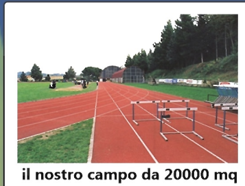
il nostro campo da 20000 mq